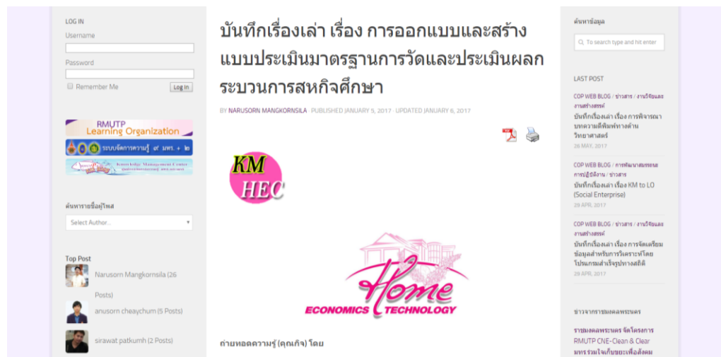
ภาพที่ 1 การแลกเปลี่ยนเรียนรู้ในรูปแบบชุมชนแนวปฏิบัติแบบออนไลน์ (Online CoP) ผ่านเว็บบล็อกชุมชนแนวปฏิบัติ

องค์ความรู้ที่มีประโยชน์ในการพัฒนากระบวนการจัดการความรู้ที่กว้างขวางขึ้นได้ และสามารถนำมาใช้เพื่อการตัดสินใจในการดำเนินการในการทำงานของบุคลากรได้ในทุกระดับ (Costa et al, 2016)