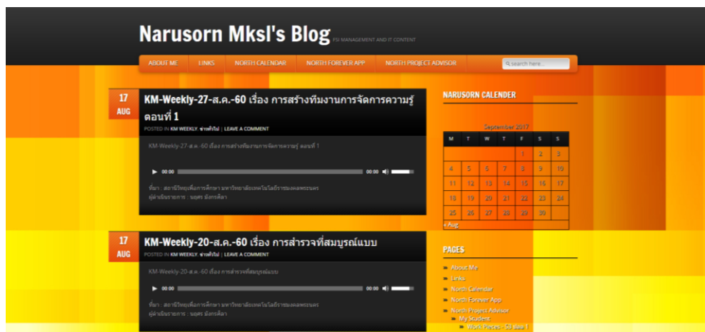
ภาพที่ 2 การถ่ายทอด และเผยแพร่องค์ความรู้ในระดับปัจเจก

ที่มา : http://blog.rmutp.ac.th/cop/๒๐๑๗/๐๑/๐๕/cop_online_coop_qa/