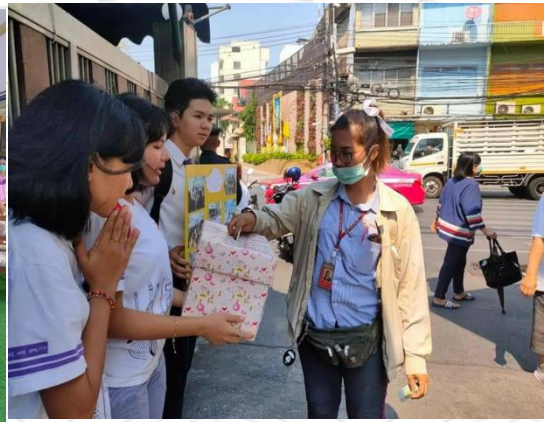
อาจารย์ที่ปรึกษาชุมชนโครงการชุมชน Anti-AIDS "เยาวชนต่อต้าน AIDS "