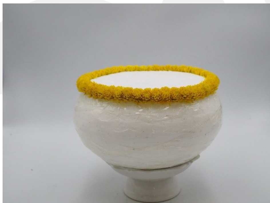
ปักดอกบานไม่รู้โรย เริ่มจากด้านบนขอบตัวบาตร โดยปักดอกบานไม่รู้โรยเรียงเป็นแถว