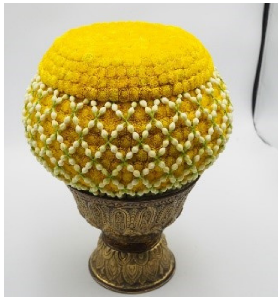
นำฝาบาตร ประกอบติดกับตัวบาตร