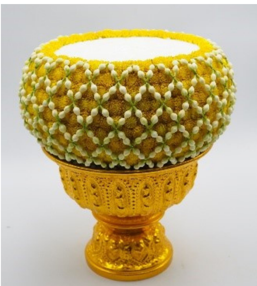
ร้อยตาข่ายแถวต่อๆ ไป ซ้ำลักษณะการร้อยแถวแรก

ร้อยตาข่ายแถวที่ 2, 3 ร้อยซ้ำลักษณะการร้อยแถวแรก