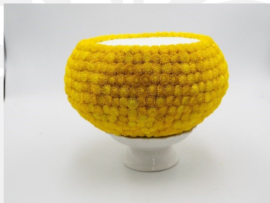
ปักดอกบานไม่รู้โรยและเรียงเป็นชั้นๆ จนเต็มตัวบาตร