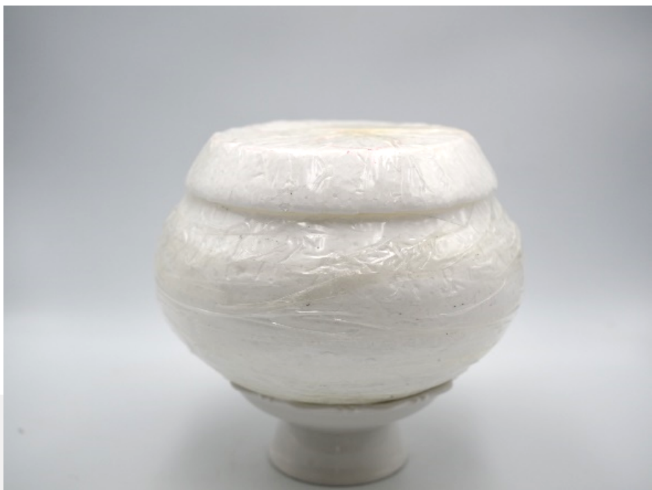
เกลาโฟมหุ่นพุ่มเป็นทรงบาตร ประกอบด้วย ฝาบาตร และตัวบาตร