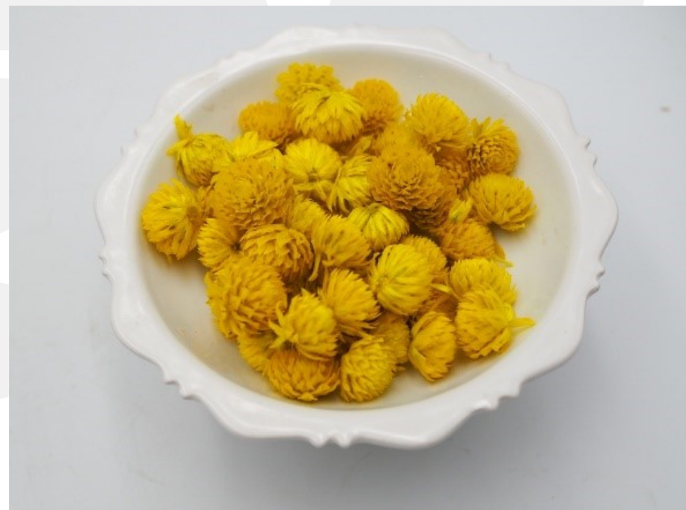
กรองดอกบานไม่รู้โรยให้มีขนาดเท่าๆ กัน ย้อมสีเหลืองตากให้แห้ง